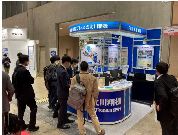
SAMPE Japan 先端材料技術展2022